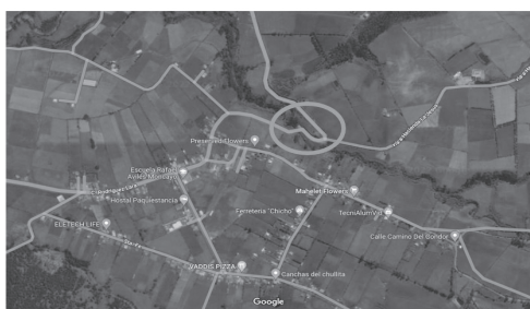
Figura No. 1 Ubicación del puente sobre la Quebrada Paquiestancia en el mapa