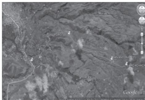
Figura N° 1 Ubicación del tramo total Vía La Bola - Larcachaca